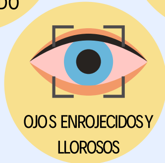
OJOS ENROJECIDOS Y LLOROSOS